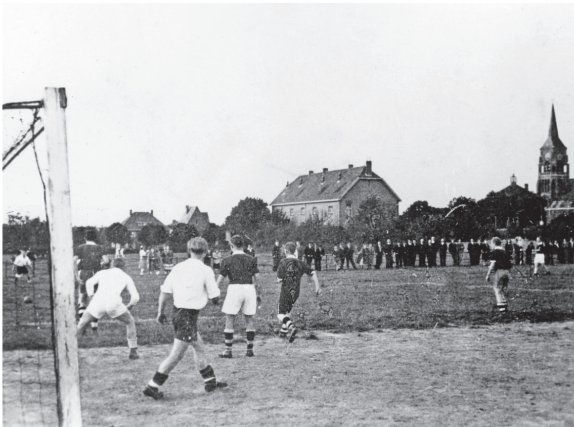
Van 1942 tot 1953 voetbalde VV Waubach op een terrein aan de Schoolstraat.